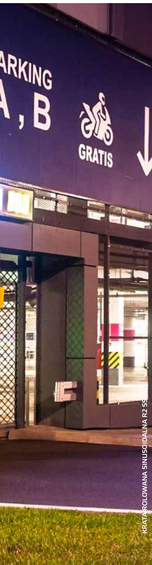
KRATA ROLOWANA SINUSOIDALNA R2 S5

Wygląd i budowa krat rolowanych zależą od miejsc, w których się je montuje i funkcji, które pełnią. W pomieszczeniach, które powinny być nie tylko bezpieczne, ale także wyeksponowane sprawdzają się kraty ze stalowych rurek prostych lub giętych sinusoidalnie. Do nowoczesnych wnętrz, wymagających wysokiego poziomu wentylacji doskonale pasują kraty aluminiowe z otworami w kształcie prostokątów. Kraty ze stalowych i aluminiowych perforowanych profili zapewniają jednocześnie przesłonę optyczną i przepuszczalność powietrza na poziomie 28%. Kraty aluminiowe i kraty stalowe zbudowane z profili perforowanych można lakierować na jeden z 200 kolorów palety RAL.