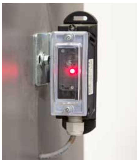
FOTOKOMÓRKA jednokierunkowa IP65