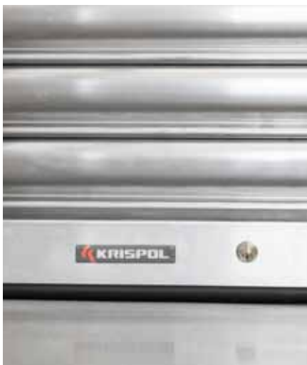
ZAMEK RYGLUJĄCY w dolnej listwie